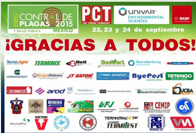
Cartel alusivo en agradecimiento a las empresas que participaron en la expo.

Los organizadores invitaron a la Sociedad Mexicana de Entomología (SME) como un vínculo académico entre los profesionales en el control de plagas y la academia. El comité organizador ofreció a los participantes que se acreditaran como miembros de la SME un descuento en su inscripción al evento. La información sobre el evento fue difundida en la página electrónica de la SME, en la red social Facebook, la página de Ingenieros Agrónomos Parasitólogos (IAP) y a toda la comunidad del Colegio de Postgraduados.