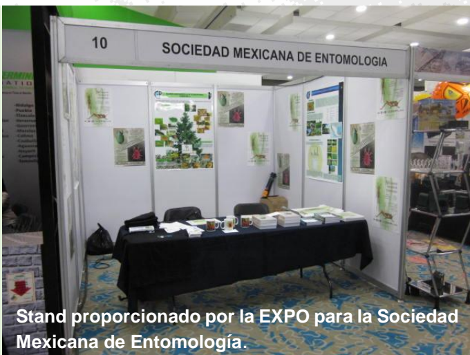
Stand proporcionado por la EXPO para la Sociedad Mexicana de Entomología.

En el stand que se proporcionó para la SME se exhibieron publicaciones impresas de algunos volúmenes de Entomología Mexicana, de las cuales los profesionales en el área mostraron interés por obtener los ejemplares, de igual manera de realizar vínculos con los investigadores de las diferentes especies de plagas a las que se enfrentan en su trabajo día a día.