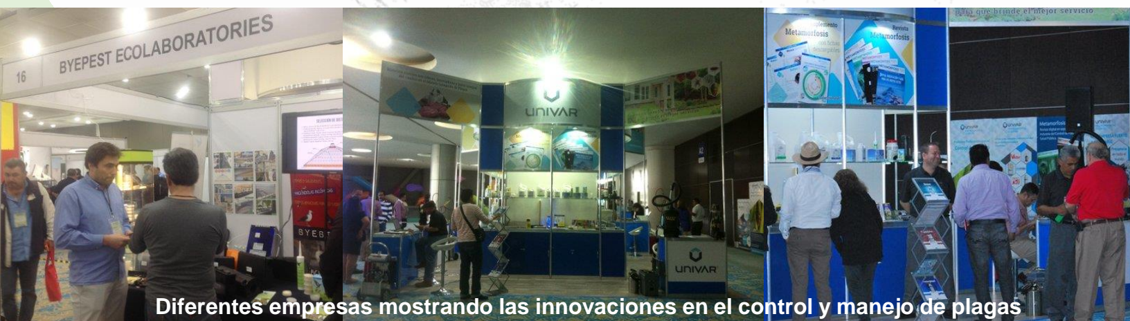
Diferentes empresas mostrando las innovaciones en el control y manejo de plagas urbanas (fotos superiores tomadas de #Expoplagas2015).