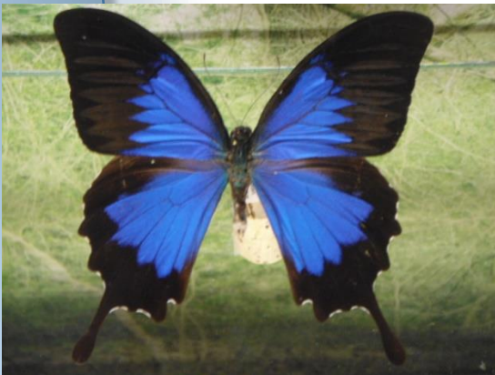
Figura 6. Adulto de Papilio ulysses L. depositado en la Colección de insectos de la Texas A&M University, College Station, Texas, Estados Unidos.

Otras especies tropicales y de zonas templadas tienen importancia en las artesanías, comercio y por los coleccionistas o aficionados. Por ejemplo, la mariposa azul Morpho peleides Kollar, M. menelaus L. la “mariposa azul de montaña” Papilio ulysses L. (Fig. 6), la “mariposa alas de cristal” Greta oto Hewitson, la “búho magnífica” Caligo indomeneus L., la “mariposa de frente negra” Tithorea harmonia (Cramer), la “mariposa cebra” Heliconis