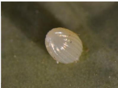
Figura 1. Huevecillo, tomado sobre Asclepias syriaca L., en el CIIDIR Oaxaca, Santa Cruz Xoxocotlán, Oaxaca.