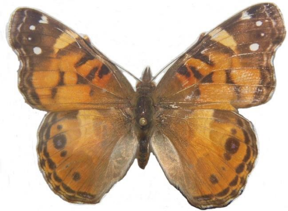
Figura 5. Adulto de Vanessa virginiensis (Drury) depositado en una Colección de insectos del Ecoturixtlán, Ixtlán de Juárez, Oaxaca.

La mariposa Vanessa cardui (L.) es otra especie migratoria, se le encuentra en todos los continentes pero sólo es residente en los países cálidos. Su ciclo de vida de huevo a adulto dura entre cuatro y cinco semanas. Las orugas se pueden alimentar de una gran variedad de plantas, pero prefieren los cardos Carduus crispus L. (Janz, 2005). Luis Martínez et al. (2004) reportan a Vanessa annabella (Field) y Vanessa virginiensis (Drury) (Fig. 5) del estado de Oaxaca.