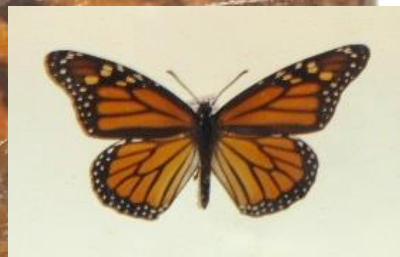
Figura 4. Adulto depositado en la Colección de insectos de del Smithsonian Museum of Natural History, Washington, D.C., Estados Unidos.

Se conocen aproximadamente 155,000 especies de lepidópteros en el mundo, de las cuales 14,500 están presentes en México (Llorente et al. , 2014) y 1,103 especies diurnas se enlistan en el estado de Oaxaca (Martínez et al. , 2004).