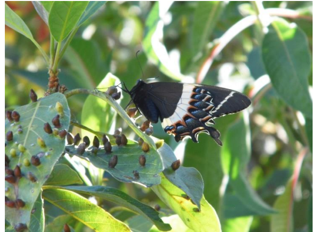
Figura 8. Adulto de Pterourus garamas abderus (Hopffer) posado en un árbol de aguacate Persea americana Mill., en Calpulalpam de Méndez, Oaxaca.

Hay otras especies que se encuentran amenazadas o en peligro de extinción, tal es el caso de la mariposa esperanza Pterourus esperanza (Beutelspacher), que solamente se encuentra en la Sierra de Juárez en Oaxaca (Romeu, 2000).