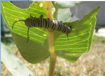
Figura 2. Larva de quinto instar alimentándose de A. syriaca , misma localidad.