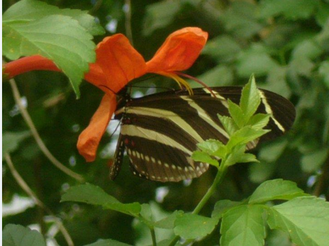
Figura 7. Adulto de Heliconius charitonia (L.) alimentándose de flores de llamarada Pyrostegia venusta (Ker Galm.) Miers en el mariposario del Zoológico Africam Safari, Valsequillo, Puebla.

charitonia (L.) (Fig. 7), la “mariposa negra” Pterourus garamas abderus (Hopffer) (Fig. 8).