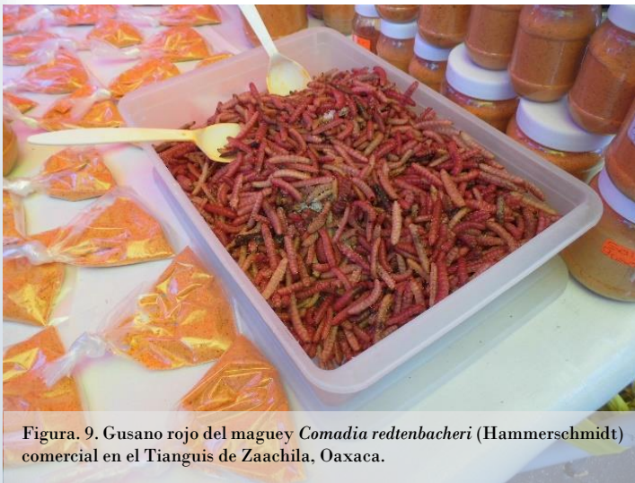
Figura 9. Gusano rojo del maguey Comadia redtenbacheri (Hammerschmidt) comercial en el Tianguis de Zaachila, Oaxaca.

Hay otras especies que se encuentran amenazadas o en peligro de extinción, tal es el caso de la mariposa esperanza Pterourus esperanza (Beutelspacher), que solamente se encuentra en la Sierra de Juárez en Oaxaca (Romeu, 2000).