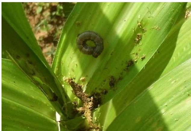
Figura. 10. Gusano cogollero Spodoptera frugiperda (Smith) alimentándose de la planta del maíz en Cuilapam de Guerrero, Oaxaca.

los estados de México, Hidalgo, Puebla, Tlaxcala, Querétaro, San Luis Potosí, Jalisco, Oaxaca, Chiapas y el Distrito Federal (Granados, 1993; Ramos-Elorduy, 2006; Llanderal-Cázares et al. , 2010), los cuales se venden en los mercados del estado de Oaxaca y se utilizan también en la industria del mezcal, sobre todo en el estado de Oaxaca.