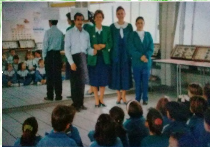
Figura 1. Primera exposición de insectos. Aguascalientes.

Cada que salía de viaje con mi familia colectaba cualquier insecto que veía. Inicialmente tuve problemas en preservarlos ya que se los comían otros insectos o se me echaban a perder y cosas por el estilo. Por ello tuve la necesidad de empezar a documentarme e investigar con otros biólogos para conocer la forma de preservarlos, también aprendí a clasificarlos por órdenes y así fue creciendo mi colección.