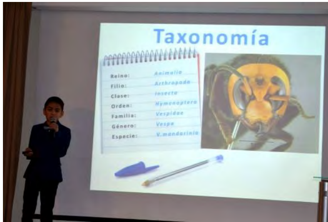
Figura 2. Ponencias orales.

Las ponencias abordaron temas sobre Insectos de áreas naturales protegidas, monografías de algún artrópodo en particular, así como la enseñanza de la entomología en educación preescolar (Figs. 2, 3 y 4). Estos proyectos fueron ingeniosamente elaborados con la premisa de: ¿Cómo enseñar entomología a niños de preescolar?, lo cual impactó a los presentes, debido al talento demostrado.