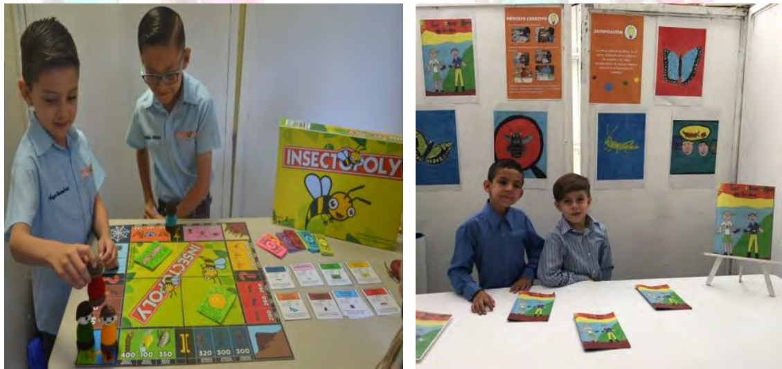
Figura 5. Izquierda. Juego Insectopoly. Derecha. Historietas de Insectos.