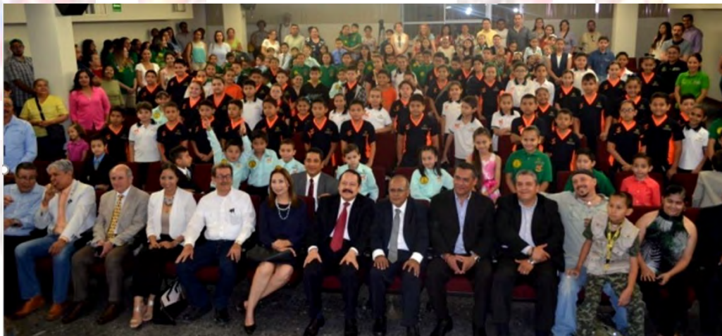
Figura 1. Auditorio de la Facultad de Ciencias Biológicas.