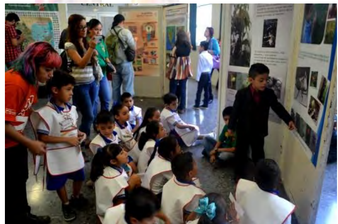
Figura 3. Ponencias en poster.

Algunos ejemplos son los memoramas, “adivina quién entomológico”, “insectmon” e “insectopoli” (Figs. 5), además de los proyectos de arte mediante dibujo, pintura en piedras, moldeados de insectos de plastilina y decoración de “quequitos” y galletas de figuras.